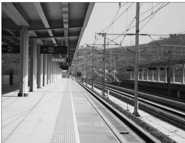
即将启用的泗水南站站台。

目前,站内的所有设备都已经进入到最后的调试阶段。下一步,泗水县将新增8条公交线路,县城直通高铁站的新公路也在紧张的铺设当中。