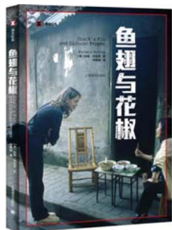
上海译文出版社 〔英〕扶霞·邓洛普 《鱼翅与花椒》 著

加拿大当代作家玛格丽特·阿特伍德以女性主义和神话主题创作闻名。这部写于1984年的小说讲述的是在未来的美国,环境严重污染,出生率骤降,境内的神权军事独裁建立了全新的男性极权社会“基列共和国”,妇女沦为被称为“使女”的生育工具。主人公奥芙弗雷德便是其中一位。她的女儿被抢走,她自己也失去自由,但在这个男权占有绝对统治地位的地方,她必须想尽办法求生。人们将这本小说视作一部反乌托邦小说,阿特伍德在1999年却说,“在这本书中,我使用的所有细节都是曾经在历史上发生过的”,这些历史包括集体处决、焚书、党卫军的生命之泉计划、蓄奴制、一夫多妻制……据悉《使女的故事》续篇《证据》将于明年9月出版,故事发生在《使女的故事》女主人公奥芙弗雷德逃出基列共和国15年之后,由三位女性人物叙述。