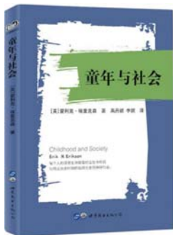
世界图书出版公司 〔美〕爱利克·埃里克森 《童年与社会》 著

作为一本心理学专著,美国著名心理学家爱利克·埃里克森的《童年与社会》对普通读者来说,读起来稍有些难度,但并不妨碍这本书的价值体现。1950年,这本书在美国第一次出版,即标志着心理社会理论(俗称生命周期八阶段理论)的初步成形。埃里克森在书中通过一些具体案例,把儿童成长期间遇到的一些心理疾病问题,与家庭和以家庭为核心的小环境,乃至所处时代的社会大环境,建立了绵密的联系。他引导人们去思考——“在我们这个时代,个体必须决定是将童年作为一个制造非理性恐惧的兵工厂,还是将成年和童年的关系以一种更加合理的方式发展为一种伙伴关系。”