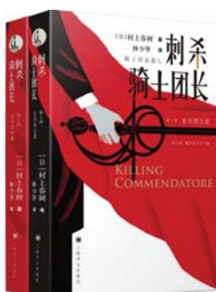
上海译文出版社 〔日〕村上春树 《刺杀骑士团长》 著

《刺杀骑士团长》仍然是一部超现实主义作品,村上春树通过写“我”在一次离婚中来到画家雨田具彦留下的房子,暂且居住,在暂住的这八个月里,经神秘邻居免色的精心策划,和少女秋川麻里惠也建立了密切联系,被铃铛响声引到了神庙背后的井,再到看见骑士团长,最后为了找到秋川麻里惠不情愿地刺杀了骑士团长,进入了虚幻的地底世界。小说中处处是隐喻,将人从现实导向迷幻的深处。村上春树自诩为“一个现实的人,一个实际的人”,但在写小说时却会走向奇怪的另一面,探寻自己内心的秘密,“我所做的就是探究自我,探究内心深处的东西”。