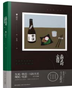
新星出版社 〔日〕北野武 《北野武的小酒馆》 著

在电影世界里,日本导演北野武以无厘头的辛辣和黑色幽默成为上世纪80年代日本喜剧热潮的灵魂人物,而在文字世界里,他是个不折不扣的“毒舌”,《北野武的小酒馆》就是他犀利自剖前半生的文学作品,讨论关于生死、教育、人际关系、规矩和电影。这本书虽然被看作“鸡汤”,但从中仍能看到北野武的真诚。现实生活中的北野武给人一种沉稳的感觉,在他看来,为了自己拍电影和因为喜欢拍电影并不是一回事。不仅电影、绘画、小说,无论什么作品都一样,都无法超越自己认为好的作品。