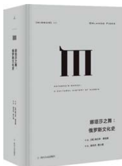
四川人民出版社 〔英〕立三·费吉斯 《娜塔莎之舞》 著

在托尔斯泰的名著《战争与和平》里,娜塔莎是一位自小接受法国教育的贵族小姐,她酷爱翩翩起舞,展现婀娜多姿、优雅动人的俄罗斯风情。奥兰多·费吉斯通过《娜塔莎之舞》,重新诠释《战争与和平》这部巨作,介绍托尔斯泰、普希金、陀思妥耶夫斯基、柴可夫斯基、契诃夫、斯特拉文斯基、肖斯塔科维奇等伟大的作家和艺术家,以散文般的笔触再现广袤质朴、包容一切的俄罗斯。书中还进一步讨论“俄罗斯灵魂”和“俄罗斯性”的建构与表现,揭示政治、国族认同、社会观念、风俗习惯、民间艺术、宗教等对俄罗斯文化的形成和发展所产生的影响。