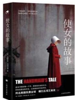
上海译文出版社 〔加〕玛格丽特·阿特伍德 《使女的故事》 著

“国王的两身体”是伊丽莎白一世时期英国法学家创制的概念:国王有一个“自然之体”,他个体的肉身,可生病、会疲弱、可朽坏;同时,国王另有一个“政治之体”,永远存续、不可朽坏。然而,政治体世俗化的发展历史塑造了超越时间的“祖国”和“人民”这样的观念,并自然地引向这个身体的“头”,即国王的永久性问题。康托洛维茨耗时十年,深入探索了“两个身体”的中世纪渊源,从浩瀚的史料中清理出各种与“两个身体”有关联的思想谱系——都指向一个根本问题:政治体永久性问题。本书推进了学术界关于西欧近代早期国家起源的争论,为政治哲学与国家建构理论厘清了一条新方向。