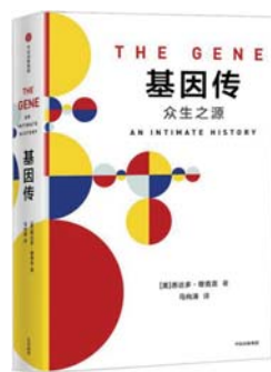
中信出版集团 〔美〕悉达多·穆克吉 《基因传》 著

印度裔美国肿瘤医生悉达多·穆克吉曾在斯坦福大学和哈佛大学取得医学博士学位,其研究集中在癌症治疗和与血细胞有关的基因功能上。他的著作《基因传:众生之源》讲述了基因理论的起源、发展和未来。书中还涉及基因理论被政治歪曲利用导致的历史灾难和教训,以及基因技术与制度、文化、伦理、道德的冲撞和博弈。人类从来没有像今天这样无限接近生命的真相,当我们能够掌控和改造人类基因时,“人类”的概念也许将从根本上发生改变,《基因传》所讲的故事与每个人都息息相关。