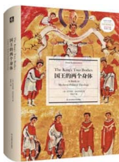
华东师范大学出版社 〔德〕罗伯特·康托洛维茨 《国王的两身体》 著

“国王的两身体”是伊丽莎白一世时期英国法学家创制的概念:国王有一个“自然之体”,他个体的肉身,可生病、会疲弱、可朽坏;同时,国王另有一个“政治之体”,永远存续、不可朽坏。然而,政治体世俗化的发展历史塑造了超越时间的“祖国”和“人民”这样的观念,并自然地引向这个身体的“头”,即国王的永久性问题。康托洛维茨耗时十年,深入探索了“两个身体”的中世纪渊源,从浩瀚的史料中清理出各种与“两个身体”有关联的思想谱系——都指向一个根本问题:政治体永久性问题。本书推进了学术界关于西欧近代早期国家起源的争论,为政治哲学与国家建构理论厘清了一条新方向。