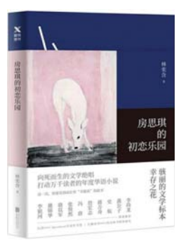
北京联合出版公司 林奕含 著 《房思琪的初恋乐园》

去年春末夏初，年仅26岁的台湾作家林奕含因不堪抑郁症的折磨自缢身亡。而她身后，则留下了一部长篇小说《房思琪的初恋乐园》。她的父母此时才告知世人：小说中房思琪就是林奕含自己，这本书在很大程度上是她的自传，她所描述的痛苦，很多就是源发于她自己的感受——她在年少时曾遭受老师诱奸，留下了长期的心理创伤。林奕含从小理想就是当作家，但在结束生命前她开始质疑文学艺术的“所谓真善美”，一句“文学辜负了她们”让热爱文学、以文学为业的人格外惊心。