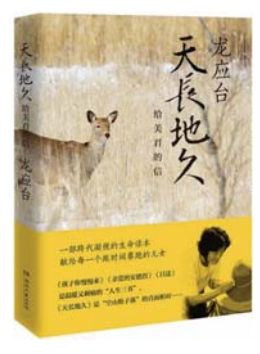
湖南文艺出版社 龙应台 著 《天长地久》

画画对于达·芬奇而言，仅仅是人生的亮点之一，在工程学、机械学、医学、地质学、植物学、水力学、军事学等科学领域，他都有相当深厚的造诣和各种奇思妙想。他在一生中留存下7200页的各类笔记手稿，这是全面认识他的一扇窗户。这份手稿包罗万象，可谓科学的“百科全书”，有数学公式、鸟类图、飞行器图、戏剧道具图、水流漩涡图、心脏瓣膜图、植物图、颅骨图、武器图等。以这些手稿作为切入点，美国传记作家艾萨克森，展现出达·芬奇谜一样的人生故事。他终生像个顽童，对科学和艺术问题热衷刨根问底，保持着求知的心态、创造的精神和探索的勇气，在科学与艺术领域精彩绽放。