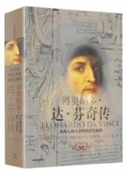
中信出版集团 美沃纳特·艾萨克森 著 《列奥纳多·达·芬奇传》