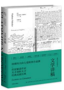
上海译文出版社 美弗拉基米尔·纳博科夫 著 《文学讲稿》

纳博科夫早年用俄文从事文学创作，移居美国后开始转用英文写作。《洛丽塔》的问世，为他带来广泛声誉。他是一位多才多产的作家，一生创作了长篇小说十七部，诗歌四百余首，短篇小说五十多篇。纳博科夫20世纪50年代在康奈尔大学等高等学府讲授欧洲文学，其后以这些讲稿为基础整理编辑成《文学讲稿》出版。在这本书里，纳博科夫讨论了《曼斯菲尔德庄园》《包法利夫人》《变形记》《尤利西斯》等七部名作，相当于带领学生做了七次艺术侦查和解剖。他认为，分析作品的前提是阅读文本，从想象文本的世界出发，而不是站在外围指手画脚。